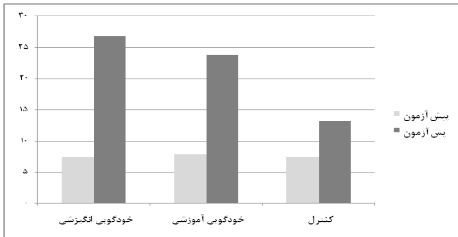
شکل ۱ - عملکرد آزمودنی‌ها در پیش‌آزمون و پس‌آزمون تکلیف تعادل ایستا