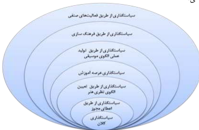
نمودار ۴ اشکال سیاستگذاری موسیقی در جمهوری اسلامی ایران

با تأمل در شرح وظایف هر یک از سازمان‌های مربوطه و نوع فعالیت‌های آنان در گذشته، می‌توان گفت که سیاستگذاری موسیقی در ایران جمهوری اسلامی به چند شکل انجام می‌گیرد: ۱. سیاستگذاری کلان ۲. سیاستگذاری از طریق اعطای مجوز ۳. سیاستگذاری از طریق تولید الگوی نظری موسیقی ۴. سیاستگذاری عرصه آموزش موسیقی ۵. سیاستگذاری از طریق تولید الگوی عملی موسیقی ۶. سیاستگذاری از طریق فرهنگ سازی ۷. سیاستگذاری از طریق فعالیت‌های صنفی