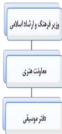
نمودار ۱ جایگاه سازمانی دفتر موسیقی

دفتر موسیقی معاونت امور هنری وزارت فرهنگ و ارشاد اسلامی در واقع عنوان متولی اصلی سیاستگذاری‌های حوزه موسیقی کشور است. شکل ساده زیر جایگاه سازمانی این دفتر را نشان می‌دهد.