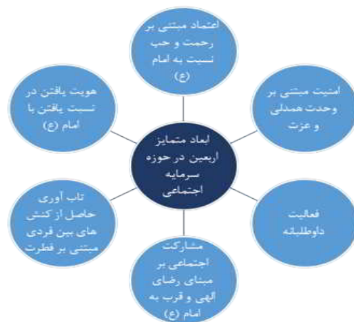
شکل ۲. مؤلفه‌های سرمایه اجتماعی شهری در ابعاد مختلف بر مبنای جریان اربعین

تنش اقوام و گروه‌های مختلف فقط زمانی توجیه‌شدنی است که سطح فعالیت‌ها و تعاملات افراد از سطح غریزه به فطرت ارتقا یابد و این اتفاقی است که در طول اربعین واقع می‌شود. در طول زیارت اربعین موضوعاتی مانند رنگ، نژاد، قومیت، حتی دین رنگ می‌بازد و نسبت افراد باهم براساس رابطه آن‌ها با امام (ع) تعریف می‌شود. مؤلفه دیگر هویت است. هویتی که در نسبت یافتن افراد با امام (ع) شکل می‌گیرد؛ این هویت هویتی اسلامی و جمعی است که افراد را به تاریخ و مظلومیت امام حسین (ع) متصل می‌شود و به وحدت یکپارچگی و همدلی منجر می‌شود.